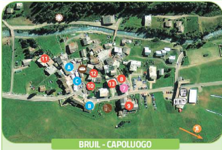
BRUIL - CAPOLUOGO