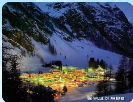
VALLE DI RHÊMES

Rhêmes-Notre-Dame è il comune più piccolo della Valle d'Aosta, a 1725 m. di altitudine. Circondato da alte montagne, praterie alpine e boschi di larici, il comune fa parte del Parco Nazionale del Gran Paradiso che si estende per 71 ettari attorno al massiccio del Gran Paradiso (4061 m slm).