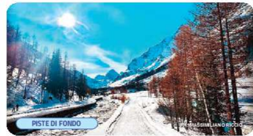
PISTE DI FONDO

mezza (all'andata) che potrete fare con tutta la famiglia. Un altro percorso consigliato con le CIASPOLE è quello del GRAND RU, sentiero che costeggia un ex canale d'irrigazione e che seguendo la SEGNALETICA ARANCIONE vi regala 2 ore a contatto con la natura, in compagnia del silenzio della montagna.